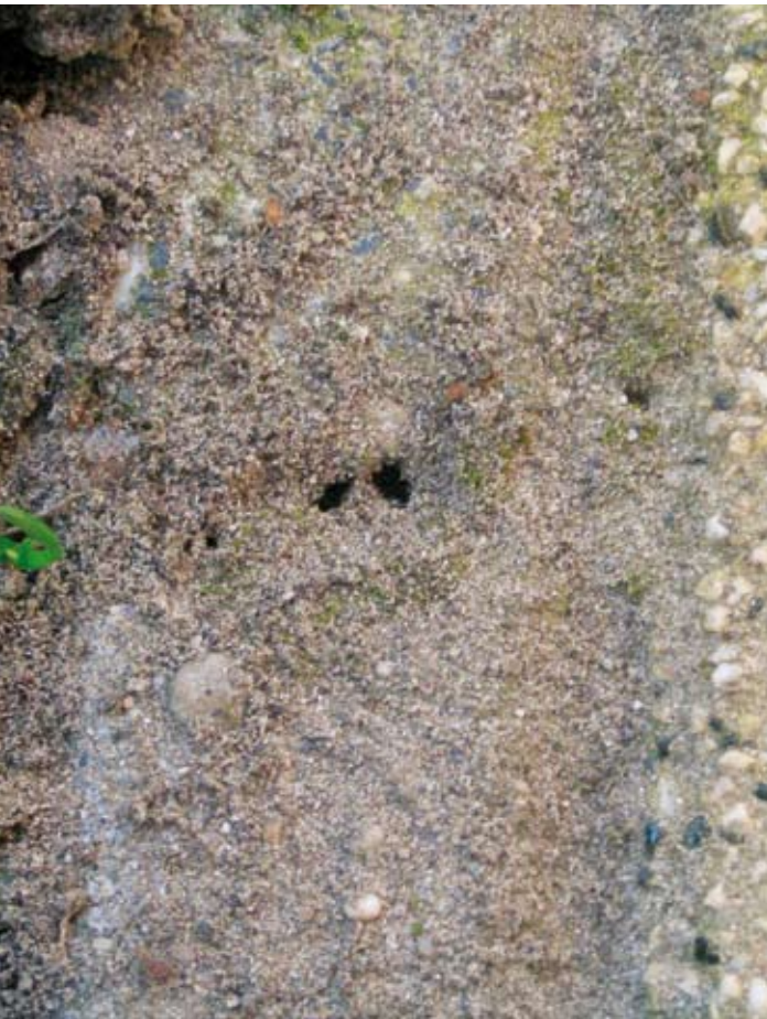
Na enige dagen: geen activiteit meer. Het bewijs dat mieren weg zijn van Maxforce LN.

Na 3 weken is er geen enkele mier meer aan de oppervlakte te zien (100% reductie).