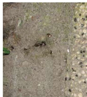
Werkmieren dragen Maxforce LN het nest in.