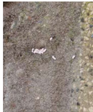
Granulaat in nestopening gestrooid.

Maxforce LN is een zeer aantrekkelijk lokaas voor suikerliefhebbende mieren. Het middel wordt snel opgenomen door het dier en bevat de zeer werkzame stof imidacloprid. Deze tast het centrale zenuwstelsel van de mier aan en is direct effectief. Tegelijk bevat Maxforce LN bitrex, een stof die opname door mensen en huisdieren voorkomt.